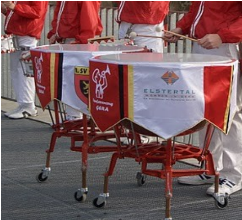
Paukenbehang Fanfarenzug Gera mit Drucktechnik