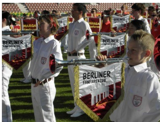
Fanfarentücher Berliner Fanfarenzug e. V. Mit hochwertiger Stickerei

Unser Hauptaugenmerk, liegt bei der Qualität in der Herstellung von Spielleutebekleidung und deren Zubehör. Bei G-Creation sind der Kreativität fast keine Grenzen gesetzt. Ob bei Hosen, Röcken, Jacken, Fanfaren- und Notenpulttüchern, sind wir stets bestrebt das Beste für Ihren Verein zu fertigen. Wir stellen den Großteil der Bekleidung, selbst und nur in Deutschland her. Ein paar wenige Referenzen, wollen wir Ihnen nicht vorenthalten.