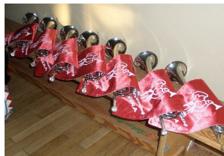
Fanfarentücher Fanfarenzug Gera mit Drucktechnik