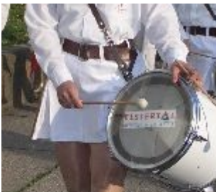
Röcke und Hosen (FZ Gera)